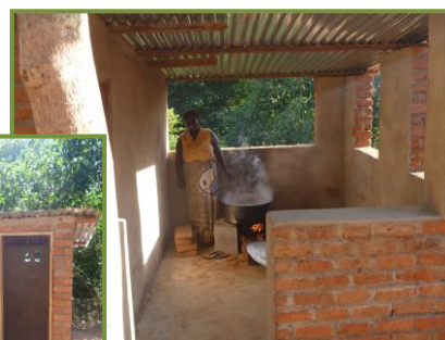
Pitlatrines en keuken bij de school in Singo.