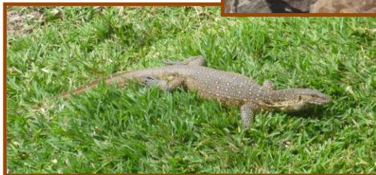
Enkele varanen in onze tuin.