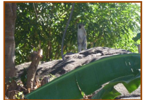
Valt er nog iets te halen...?