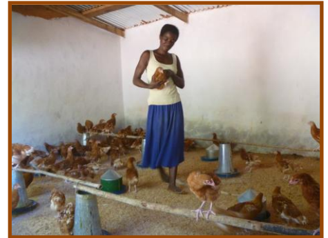
Wakisa in het kippenhok